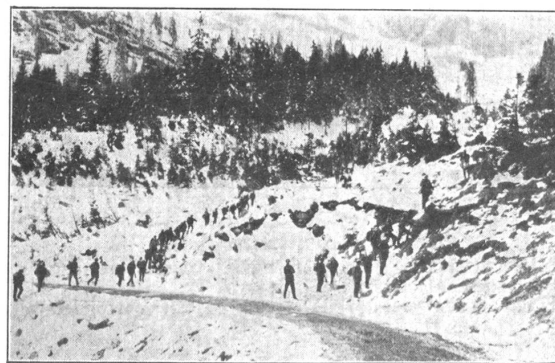
Vormarsch mit geöffneten Gliedern. Avance en colonnes ouvertes.

Les toiles des tentes sont aussi utilisées comme manteaux pluie.