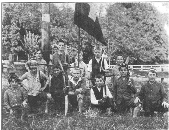
Jugend im Manövergebiet. Des descendants de Tell!

Voici, pour terminer, quels sont les effectifs prévus par une ordonnance ministérielle de novembre 1927 : 24 chiens par régiment d'infanterie, 4 chiens par groupe d'artillerie attelée ou montée. En outre, chaque école d'infanterie est dotée de deux chiens servant à l'instruction générale de la troupe.