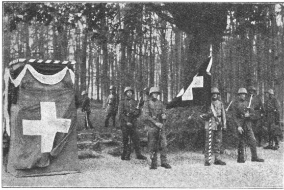
Kanzel mit Fahnenwache. La garde du drapeau près de la chaire.