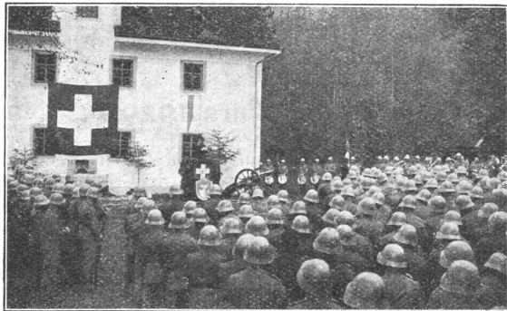
Feldpredigt. — Culte militaire.