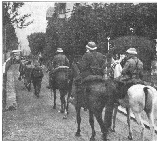
Manövermarsch. — En manœuvre.