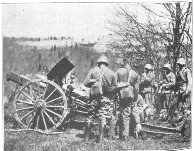
Artillerie mit Gasmasken. Artilleurs munis du masque.

Für den einzelnen Landwehrmann aber war der Wiederholungskurs ein Erlebnis. Er traf die meisten seiner Kameraden wieder, mit denen er Freuden und Leiden der langen Aktivdienstzeit geteilt hatte. In der Erinnerung blieben nur die frohen Momente, und da