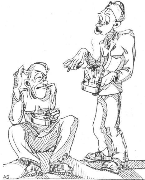
Humor der Füs.-Kp. 1/54. L'humour à la cp. füs. 1/54.