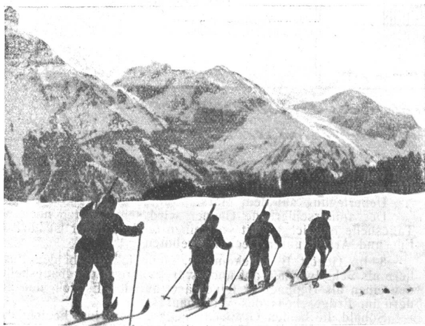
Skipatrouille auf der Fahrt, im Hintergrund der Juchlipass.

Die Geb.-J.-Br. 10 hat im letzten Winter in der Kaserne Andermatt über die Neujahrs-Feiertage einen siebentägigen Skikurs , in der Hauptsache für Unteroffiziere und Soldaten, durchgeführt.