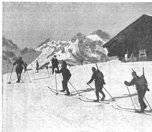
Patrouille auf der Strecke Gerschnialp, im Hintergrund der Hahnen, das Wahrzeichen Engelbergs.