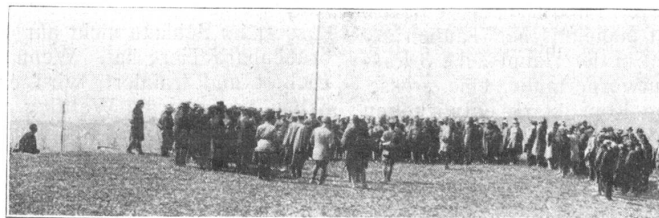
Manöverkritik. Critique après la manœuvre.

Bei der Pferdeverpflegung steht der Hafer an erster Stelle. Als Hauptlieferant dominiert Amerika. Etwas