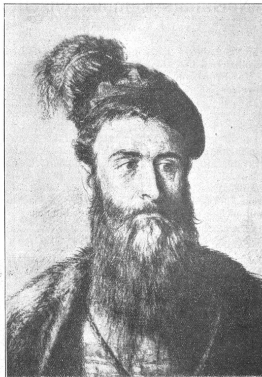
Hans Waldmann, gest. 6. April 1489 (mort le 6 avril 1489).

Ueber das Auftreten der Truppen sei eine Stelle aus einer in Rheinfelden aufgefangenen Meldung spionierender Mitglieder des jenseits des Rheins zum Einmarsch bereitgestellten deutschen roten Frontkämpferbundes erwähnt, in der es u. a. heisst, das Regiment mache einen «verdammt strammen Eindruck».