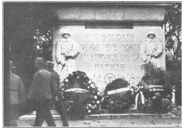
Un souvenir des soldats genevois morts pour la patrie.

Nun ist es zehn Jahre seit das blutige Ringen Europas ein Ende genommen hat. Ueberall wird der Helden von 1914 bis 1918 gedacht. Die ganze Presse bringt die verschiedenen Feiern und Nachrufe, aber mit wenigen Ausnahmen wird derer gedacht, die für unser Heimatland ihr Leben gaben. Liebe Kameraden, kehrt einmal im Geiste in die Kriegsjahre 1914 bis 1918 zurück, und vor allem in die Novembertage 1918. Haben wir da nicht auch Helden zu ehren? 1918, wo nach dem Zusammenbruche der Mittelmächte die Woge des Umsturzes ganz Europa, und dabei auch unser Schweizerland zu vernichten drohte, waren es da nicht die zum Aeussersten entschlossenen Truppen, die uns die Heimat erhielten, die trotz der verheerenden Grippe zusammenstanden zum Schutz des Vaterlandes. Also, liebe Kameraden, auch wir in unserem Schweizerland haben Helden von 1914 bis 1918. Wollen wir zurückstehen vor den Nachbarstaaten? Sollen ihre Leistungen vergessen werden, soll die Heimat die zu ihrem Schutze verstorbenen Söhne nicht mehr kennen? Nein, heute, nach zehn Jahren, wollen wir auch ihrer gedenken, ihrer Leistungen und ihres Opfermutes, mit dem Gelöb-