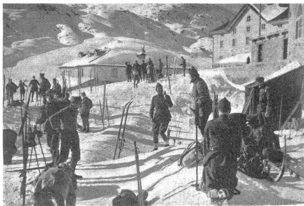
Vor der Abfahrt auf Gotthard-Hospiz. Avant le départ pour l'hospice du St-Gothard.

Die nachfolgenden Arbeitstage, die leider nicht von schönem Wetter und guten Schneeverhältnissen begünstigt wurden, waren sehr streng und wurden bis auf die Minute gut ausgenützt. Die Normaltagesordnung für alle Klassen war ungefähr folgende: