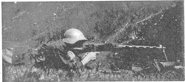
L. M. G.

Dieser Vorbereitung, die von Oberstkorpskommandant Sprecher und seinen Mitarbeitern in mustergültiger Weise getroffen worden ist, verdanken wir zu einem guten Teil das wunderbare Schicksal unserer Eidgenossenschaft in all dem Unglück, das der Krieg über die Menschheit gebracht hat. Je grösser die Entfernung zu jenen Ereignissen wird, desto grösser wird auch das