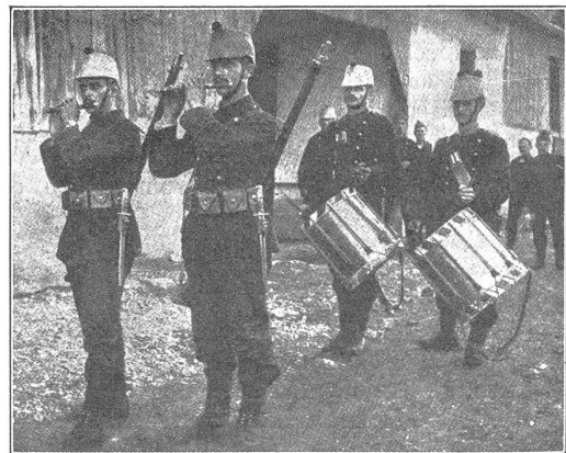
Basler Kompagnie-Spiel 1914-18.

Die Sachlage ist so klar, dass man geradezu die Augen schliessen muss, um sie nicht zu sehen. Zahlreich sind denn auch die Leute, die anerkennen, dass wir zu einem wirksamen Grenzschutz fähig seien. Wie steht es