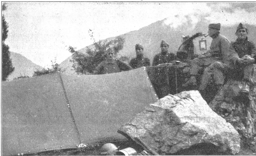
Ce qu'on fait le soir au bivouak