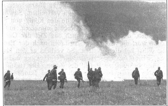
Infanterie rückt unter künstlichem Nebel vor.

«Drei Siebtel» antwortete der Instruktor kaltblütig und zündete sich eine Zigarette an.