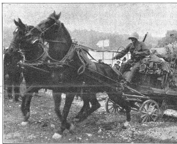
Der Train kommt.