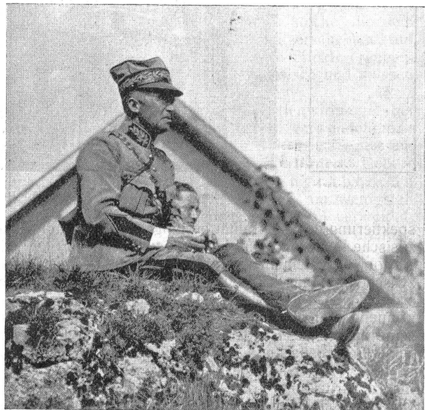
Divisionär Guisan (2. Division). Hohl, Arch.

Ebene vorstossen und sich auf den Rhein stützen sollte. Zur Vorbereitung dieser Aktion sollten das 7. Armeekorps und die 3. Kavalleriedivision aus dem „Loch von Belfort“ in direkter Richtung auf Colmar vorstossen; nebenbei sollte dieser Teil der 1. Armee sich bemühen, den Badischen Bahnhof in Basel und die Eisenbahnbrücke von Neuenburg (unterhalb der Hüniger Schiffs-