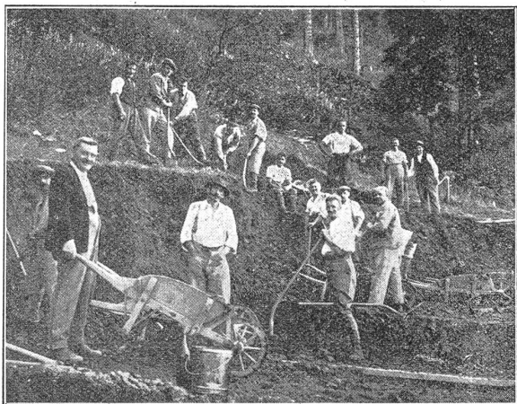
Ecole de section volontaire.

A l'heure où l'esprit de sacrifice semble s'affaiblir pour faire place au « chacun pour soi », à l'heure où l'esprit de corps paraît avoir disparu de nos mœurs sociétaires pour faire place à une sorte d'individualisme affligeant, il est bon de relever les cas où des hommes clairvoyants comprennent encore que l'esprit de société exige des sacrifices, un peu de don de soi, de son temps, de ses aises, de ses forces même, sur l'autel de la communauté. Si ces hommes-là se font rares, il est réconfortant de constater qu'il s'en trouve encore malgré tout et malgré l'affarisme tentaculaire qui nous a enveloppés dans l'après-guerre. La section de Montreux des sous-officiers vient de faire cette expérience. Il s'agissait d'améliorer sensiblement la piste de saut d'Orgevaux où sera organisé en janvier prochain le 2 me concours fédéral de ski de la Société des Sous-officiers. Une grosse somme était nécessaire et la caisse n'eût pas permis la réalisation en une fois du projet caressé. Un seul moyen restait efficient: la corvée. Faire appel à la bonne volonté de tous était l'affaire d'une lettre circulaire.