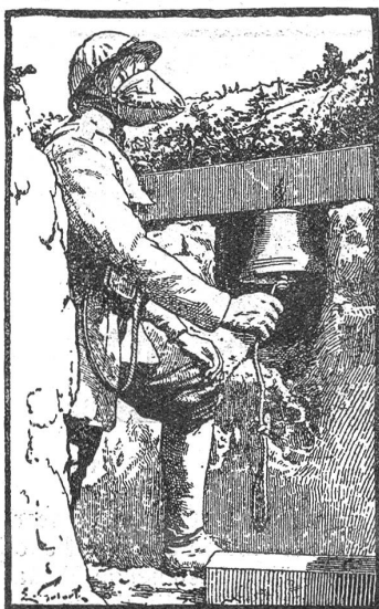
Gasalarmglocke während der Krieger. Cloche d'alarme (gaz) pendant la guerre.

Das ist der Weckpfiff und Wachruf für unsere Gebirgsappeure im Bergell. Aber nicht Gewehrgriff-klopfen und Rucksacktragen harrt unser, sondern Steine klopfen und Balken tragen. Wir sind am Rettungswerk