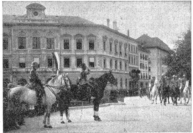
Défilé Reg. 11.