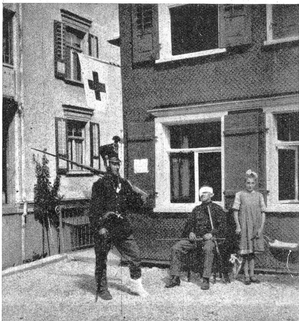
Eine fröhliche Erinnerung aus dem W. K.

Die Gewehre standen nun im Rechen vor dem Kantonement, versehen mit Etiketten, und wir, wir standen in fabelhaften, in den Knien leicht gebogenen Arbeitshosen, die noch ganz anders nach Mottentod dufteten und schon jahrzehntelang geduftet haben mochten, und in Exerzierkitteln mit rötlichen Nähten und nötlichen Flickern — und die nigelnagelneue Herrlichkeit des Waffenrocks mit Zutaten war nicht zum Zwecke