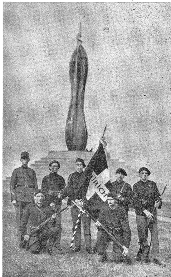
Fahnengruppe der Jungwehr Zürich-Stadt. Groupe du drapeau de la Jungwehr de Zurich.

sache, dass der Schweizerische Unteroffiziersverband wiederum rund 4000 Jünglinge auf den Dienst fürs Vaterland vorbereitet hat, vollendet sein. Auch der diesjährige Kurs ist geeignet gewesen, die daran beteiligten Offiziere, Unteroffiziere und Schüler mit grosser