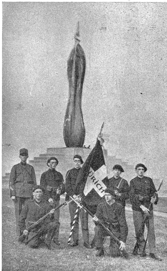
Fahnengruppe der Jungwehr Zürich-Stadt. Groupe du drapeau de la Jungwehr de Zurich.

sache, dass der Schweizerische Unteroffiziersverband wiederum rund 4000 Jünglinge auf den Dienst fürs Vaterland vorbereitet hat, vollendet sein. Auch der diesjährige Kurs ist geeignet gewesen, die daran beteiligten Offiziere, Unteroffiziere und Schüler mit grosser