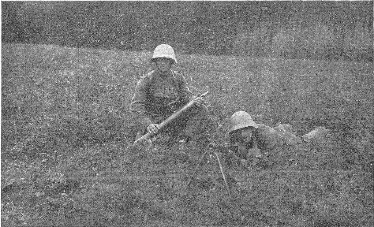
Das L. M. G. (auf Vorderstütze) im Felde. Der zweite Füsilier hält den Wechsellauf bereit. (Er soll natürlich liegen.) Le fusil-mitrailleur au camp. Le second fusilier tient le canon.

7. Welche nit schiessen, die sollent Usserhalb der Lähnen blieben, Wer aber hinein gaht, ist zu Buss 1 B.