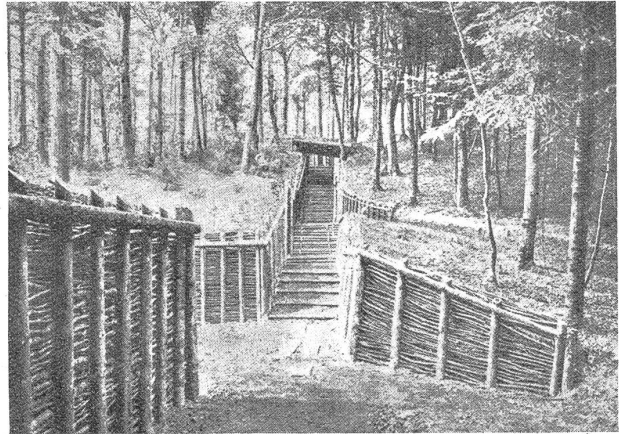
Ein mustergültiger Laufgraben.