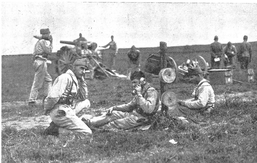
Telephonbetrieb einer Batterie.