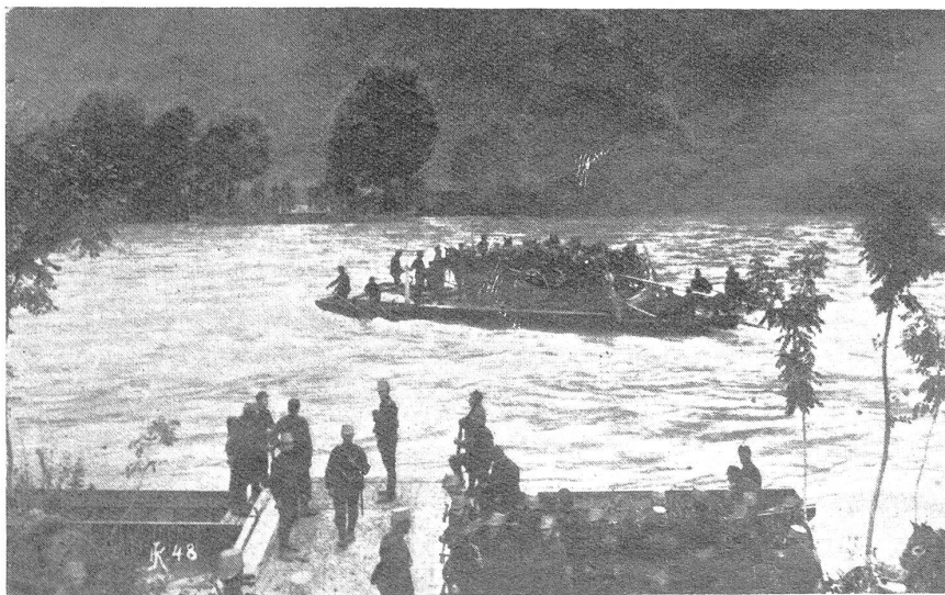
Artillerie wird auf Flössen über die Aare gesetzt (Vgl. Text.)

Ausstellung hindurch, streiften auch noch ein Teil der Stadt Bern und nachher ging es unter der Glut der heissen Augustsonne im Schritt und Trab über Zollikofen, diesmal eine Aarebrücke benützend, nach Schüpfen zurück, das wir in den Nachmittagsstunden wieder erreichten, allerdings über und über mit Staub bedeckt, aber schön und interessant war dafür jene Uebung doch gewesen. Einige Tage später, es war am 27. August, lautete der Tagesbefehl: Gefechtsübung im Abteilungs-Verbande im Abschnitt Frienisberg, verbunden mit Biwakbezug. Schon früh am Morgen zogen wir los, auch der Küchentrain war hierzu aufgeboden. Nachdem am Vormittag verschiedene Stellungsbezüge mit unterstützter Gefechtsannahme ausgeführt worden waren, wurde nach