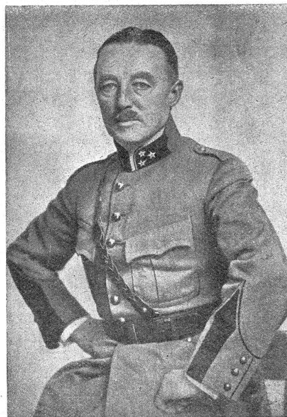
Oberst Henry Guisan, der neue Divisionskommandant 2.