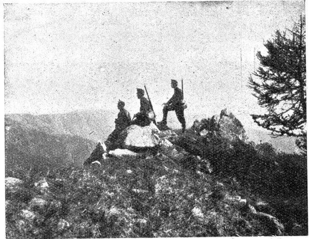
Blick nach Italien.

bunteren Alpenweiden eingefasst. Das Dorf macht durchaus den gleichen Eindruck wie die andern Tessinerbergdörfchen. Die Häuser aus Granit bilden eine einzige graue, eng zusammengedrückte Steinmasse. Auf den abbröckelnden Mauern mit ihren zerfressenen Steinen wuchert da und dort das Fettkraut. Fenster und Eisenbalkons einzelner armseliger Steinhütten