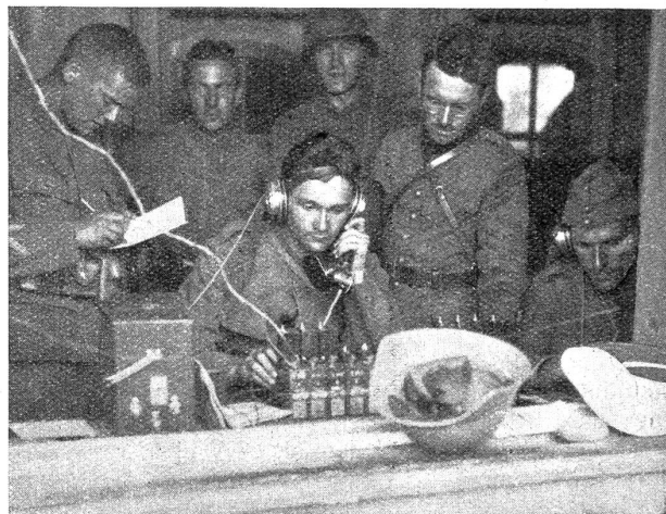
Betrieb in einer Telephonstation.

nössische Buss- und Bettag dazu benutzt worden ist, gegen unser Wehrwesen zu predigen, statt Gott und der Armee auf der Kanzel dafür zu danken, dass wir vom Weltkrieg verschont worden sind. Wir können uns