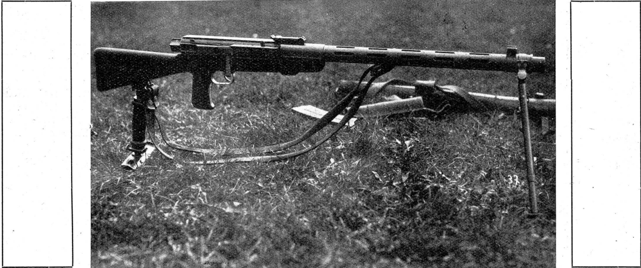
Das neue L. M. G. 25.

nächste Jahr wird nun zum grössten Teil der Ausbildung der Infanterie und Kavallerie am leichten Maschinengewehr gewidmet. Hierzu bedarf es einer fünf-tägigen Spezialvorbereitung der Offiziere und eines Teiles der Unteroffiziere vor dem Wiederholungskurs. Die