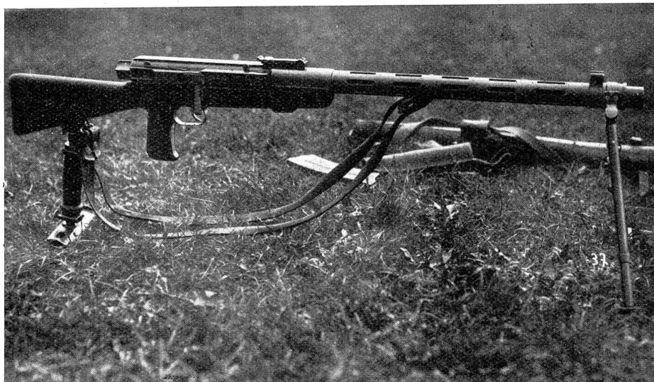
Das neue L. M. G. 25.

nächste Jahr wird nun zum grössten Teil der Ausbildung der Infanterie und Kavallerie am leichten Maschinengewehr gewidmet. Hierzu bedarf es einer fünf-tägigen Spezialvorbereitung der Offiziere und eines Teiles der Unteroffiziere vor dem Wiederholungskurs. Die