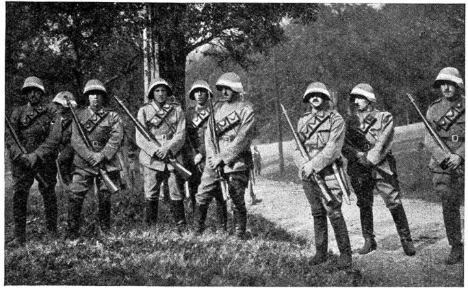
Kavalleriepostierung vor dem Feind.

Heute früh, beim Gewehrgriffübun, liess uns, alle zugleich, ein mächtiges Brausen die Köpfe in die Höhe heben. Ein grosses Geschwader — es waren ihrer zwanzig — zog in einem gewaltigen Bogen über die Stadt und das Exerzierfeld hin. Nun kreisten sie über uns, und deutlich hob sich, von den Strahlen der Sonne