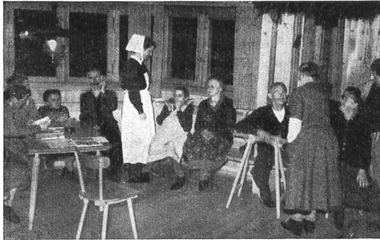
Diakonie am Gebrechlichen

sollten auch Wochen für Trinkerrinnen und für Frauen von Trinkern eingerichtet werden. Ganz besonders schön war im Herbst das Wochenende für die Teilnehmer der letztjährigen Besinnungswoche, die zum Teil mit ihren Frauen erschienen, und strahlten über alles, was sie empfangen durften und in der