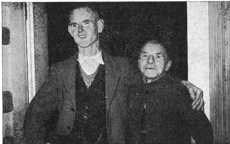
Zwei unzertrennliche «Sonneblick»-Freunde aus dem Appenzellerland

Gott segnet und stärkt durch Gemeinschaft. Das erlebt zu haben war die grosse und reiche Erfahrung des Berichtsjahres. Ueber Pfingsten fand die Zusammenkunft der Association Suisse des Paralysés, der Schweizerischen Vereinigung von Gelähmten und Invaliden, statt. Das starke Interesse für unsere