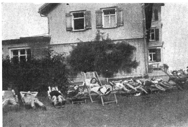
«Siesta» der jungen Holländer

Es kamen aber auch andere Menschen zu uns, solche, die Kriegsnot und das ganze namenlose Kriegselend erlebt hatten. Es kamen bleiche, magere Kinder aus Holland, die aus leeren und freudlosen Augen einem fragend anschauten. Eine schöne