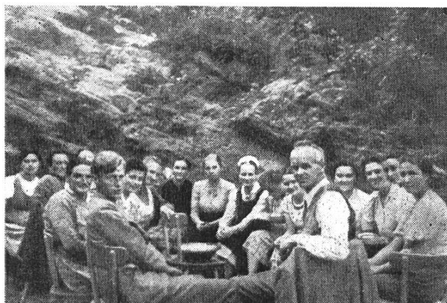
Sonntagsschulkurs im «Sonneblick»-Garten

Zum Schluss möchte ich auch noch die verschiedenen Kurse und Tagungen streifen, die während dem ganzen Jahre bei uns stattgefunden haben: Den sich alljährlich wiederholenden Sonntagsschulkurs für Anfänger und Fortgeschrittene, die bereits erwähnten Besinnungswochen, einen Studienkurs für deutsche Militär-Internierte, spezielle Ferienwochen für Bauernfrauen und Tagungen der verschiedensten Art auf kirchlichem und sozialem Gebiete.