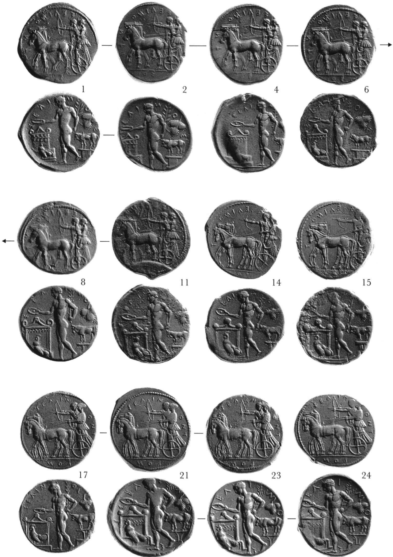
Christof Boehringer, Zum Münzfund von Selinunte 1923 (IGCH 2084)