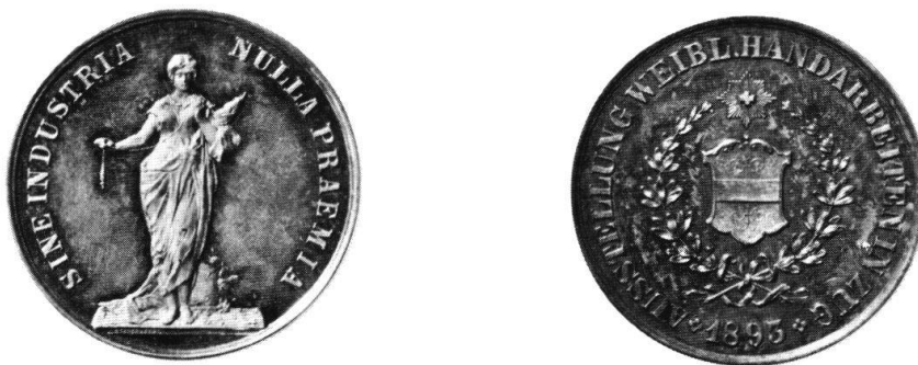
Abb. 4 Die Preismedaille der 1893 in Zug veranstalteten Ausstellung weiblicher Handarbeiten.

Die dritte für die Schweiz bestimmte Prägung, zu der in Stuttgart heute noch Werkzeuge vorhanden sind, ist eine Preismedaille, die 1893 in Zug bei einer Ausstellung weiblicher Handarbeiten ausgegeben wurde. Da dieses sehr seltene Stück bisher erst in zwei Exemplaren nachgewiesen werden konnte – das eine ist als Beleg in Stuttgart