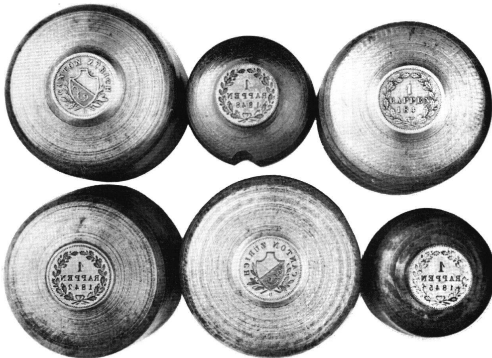
Abb. 2 Die erhaltenen Werkzeuge der Zürcher 1-Rappen-Prägung der Jahre 1842-1848 (jeweils von links nach rechts, obere Reihe: V 3, R 6, R 3, untere Reihe: R 4, V 4, R 5).