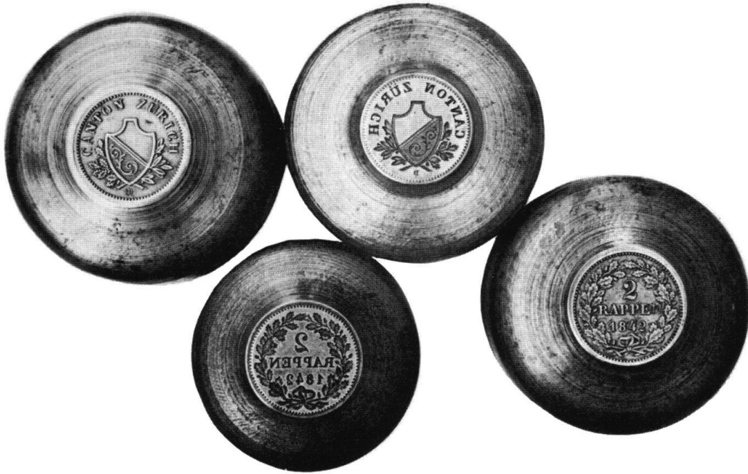
Abb. 1 Die erhaltenen Werkzeuge der Zürcher 2-Rappen-Prägung des Jahres 1842 (jeweils von links nach rechts, obere Reihe: V 1, V 2, untere Reihe: R 2, R 1).