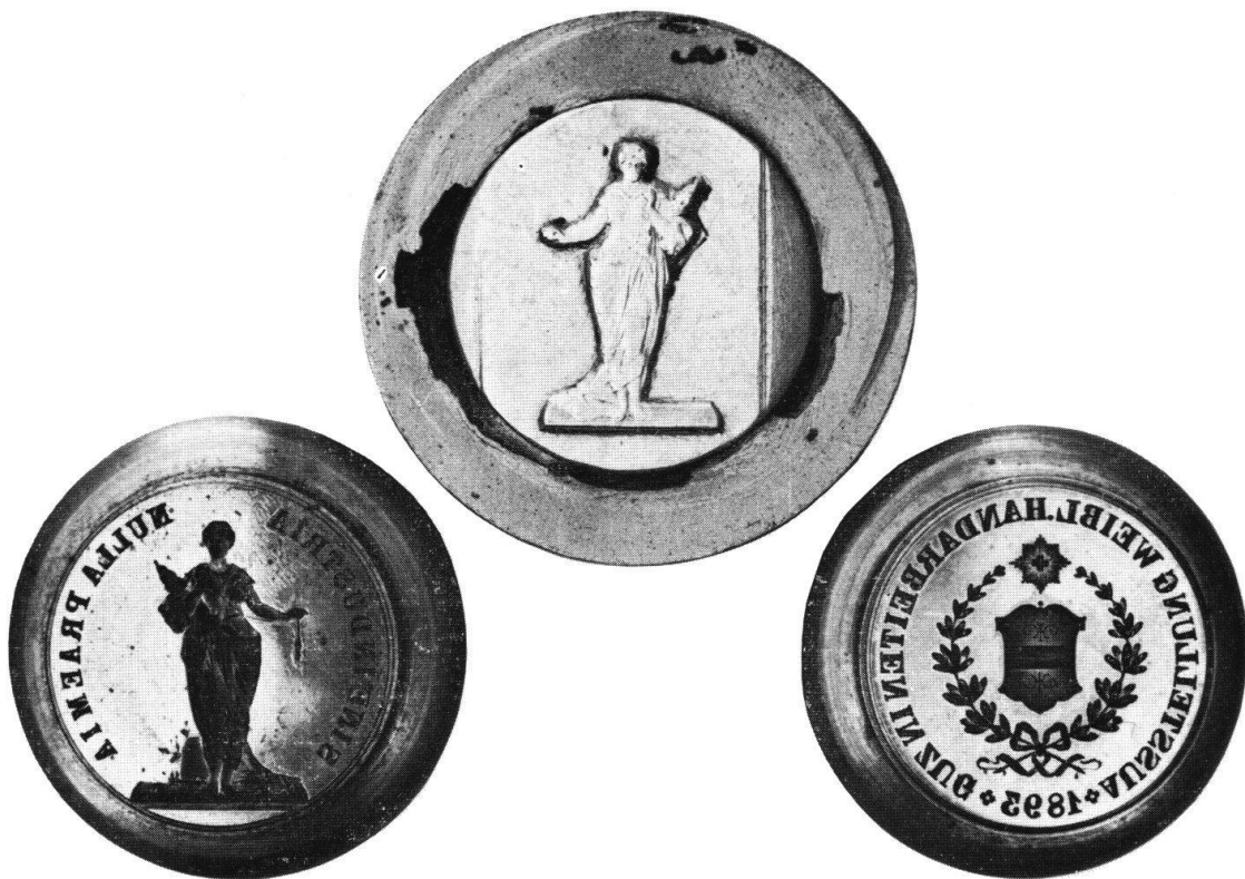
Abb. 5 Die Bildpunze und die beiden Prägestempel der Zuger Preismedaille aus dem Jahre 1893.

Einen weiteren Beweis für die Entstehung der Zuger Medaille in Stuttgart liefert neben dem erwähnten Belegstück und den Werkzeugen ein in Privatbesitz befindliches, noch unveröffentlichtes handschriftliches «Preis-Verzeichnis der in der Königl. Münze zu Stuttgart zur Prägung kommenden Medaillen». Dieses Verzeichnis, das angesichts des Verlusts der Stuttgarter Münzakten einen beachtlichen dokumentarischen Wert hat, enthält ungefähr 35 Medaillen aus der Zeit von etwa 1850 bis 1896/1897. Die Angaben zu den einzelnen Prägungen, die entsprechend dem Anlaß ihrer Verwendung in verschiedene Rubriken eingeteilt sind, informieren neben einer kurzen Bezeichnung über den Durchmesser, das Metall, das Gewicht und den Preis. Das Zuger Stück, das natürlich in dem Abschnitt über die Preismedaillen erscheint (Abb. 6), wurde demnach ausschließlich in Silber und nur in der einen, schon bei der Beschreibung genannten Größe hergestellt. Bei der Gewichtsangabe der für 4 Mark verkauften Prägung handelt es sich, wie eine Überprüfung anhand der beiden nachgewiesenen Exemplare zeigt – sie wiegen 21,71 g und 21,55 g –, um einen gerundeten «Soll»-Wert. Wenn man aus diesen Daten den der Preisangabe zugrundegelegten Silberpreis errechnet, ergibt sich pro Gramm ein Betrag von 18 Pfennigen 67 . Dieser