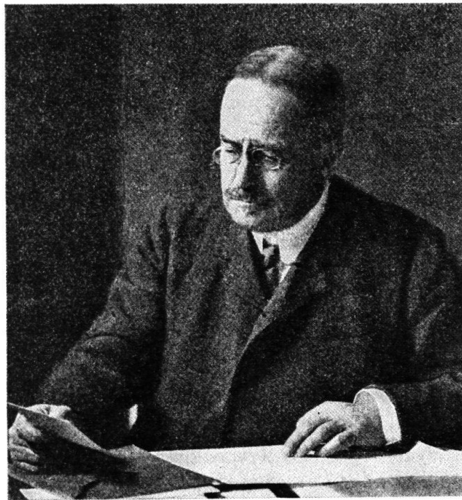
Eugène Demole, Präsident 1908–1924.

spezialisierte sich auf die Farbbildherstellung 1 . Zum «Fin lettré» erzog er sich selbst. Kurz nach 1880 trat er in das noch sehr kleine «Cabinet de numismatique» ein, dem er ab 1882 fast dreißig Jahre lang als Konservator vorstand. Es war sein Verdienst, daß der Bestand an Genfer Münzen für die Epoche von 1535 bis 1848 um 5600 Stück erweitert werden konnte. Im Jahre 1887 erschien sein Hauptwerk, «Histoire monétaire de Genève». Zusammen mit seinem Freund, dem Neuenburger Konservator William Wawre bearbei-