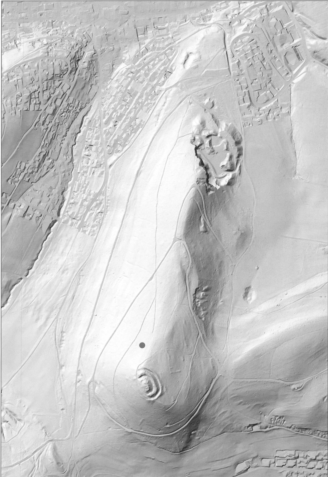
Abb. 3 Die Fundstelle des Ensembles von Pratteln BL.