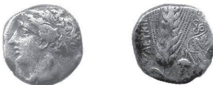
Fig. 3 Statere, al rovescio ΛΕΥΚΙΠ[ΠΟΣ?]. Collezione privata.

D/ Testa femminile volta a sinistra, probabilmente di Demetra R/ spiga di orzo con sette grani per lato; nel campo, a sinistra, ΛΕΥΚΙΠ[ΠΟΣ ?], dal basso verso l'alto, a destra, tralcio di vite con foglia e grappolo d'uva. AR 7,14 g, 19 mm, h 1.