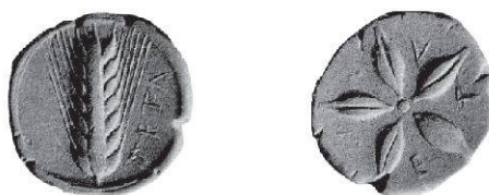
Fig. 2 Statere della serie a doppio rilievo. Noe Johnston, n. 310.

Il peso di questa frazione è inferiore a quello teorico di circa 1,3 g ricavabile dal peso medio di 7,84 g ottenuto da sette stateri con gli stessi tipi 3 (i primi a doppio rilievo a essere conati a Metaponto) (Fig. 2), ai quali può certamente essere associato il nostro di obolo 4 . Un peso così leggero si spiega con la forte usura dovuta alla lunga circolazione dell'esemplare, ma anche alla penuria di piccoli nominali sul mercato cittadino per il periodo nel quale normalmente vengono datati gli stateri (440–430 a.C.) da Johnston e Rutter. I trioboli incusi “spiga / testa di toro”, con i dioboli “spiga / grano d'orzo”, le ultime frazioni a essere coniate con questa tecnica, immediatamente precedenti il nostro diobolo, sono stati infatti battuti non molto abbondantemente, e risultano spesso anch'essi molto consumati dall'uso 5 .