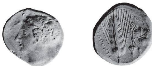
Fig. 4 Statere di Metaponto. Noe Johnston, n. 470.

L'esemplare trova un chiaro aggancio di conio per il dritto con i nn. 467–472 raffigurati nella monografia di Noe Johnston (= HN 3 Italy , p. 134, n. 1525) che essendo ben conservati mostrano tracce di una corona di spighe di orzo nei capelli, e permettono quindi di identificare la dea proprio come Demetra ( Fig. 4 ), mentre il rovescio, pur essendo identico al nostro quanto ai tipi dei nn. 470 e 471, mostra la legenda di cui sopra al posto delle iscrizioni METAPONTI e METAPIO presenti in quest'ultimi, rispettivamente.