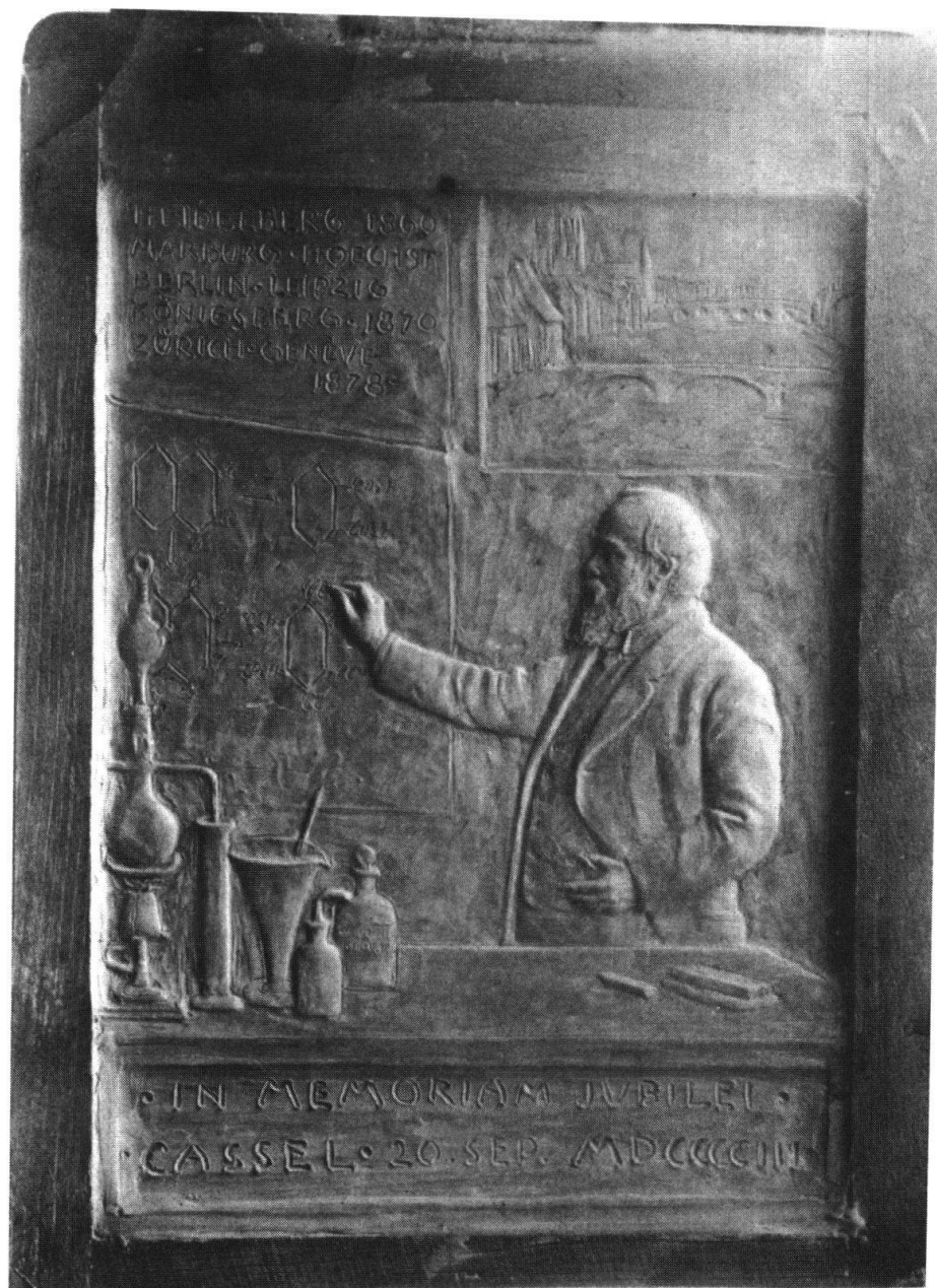
Abbildung 1 Entwurf (vermutlich Wachsmode) zur Graebe-Plakette von Hans Frei. Sondersammlungen Deutsches Museum München, Bildnummer 1210/1.