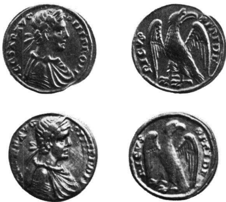
Abb. 21 Moderne Augustalenfälschungen aus «Dukaten-gold»! (Kat.-Nrn. 52 b und 51.)

Während es bei den falschen Tarenen sowohl imitierte als auch erfundene Typen gibt, sind die mir bekannten modernen Augustalenfälschungen stets genaue Kopien echter Stücke, allerdings mit «falscher» Stempelkopplung. Die meisten (Kat.-Nrn. 52, a + b, 227, 358, 397, 406) entsprechen der Varietät U 4/A 28 und zwei (Kat.-Nrn. 51 und 407) der Varietät U 7/A 21, wohingegen bei den echten Stücken bisher nur die