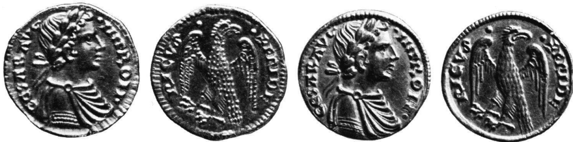
Abb. 22 Moderne Halbaugustalenfälschung . Links: Fälschung aus fast reinem Gold (Kat.-Nr. 257). Stempelstellung ↑ ! Rechts das echte Vorbild (Kat.-Nr. 128), Stempelstellung ↓ . Etwa zweifach vergrößert.

Auch von einer Halbaugustalenvarietät (K91/B83) fand ich außer sieben echten Exemplaren mehrere suspekten Stücke (Kat.-Nr. 2, 132, 257, 333, 536). Sie existieren seit über 50 Jahren, ohne bisher Verdacht erweckt zu haben, und fallen dadurch auf, daß bestimmte Details, insbesondere das Auge, der Armreif und die Adlerfedern, nachbearbeitet sind, und zwar bei jedem Exemplar in etwas anderer Weise (Abb. 22).