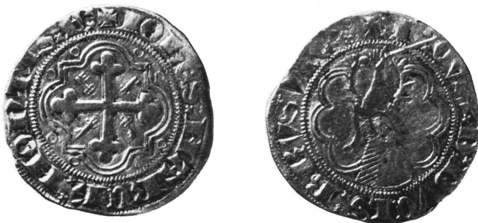
Demi-gros (grossi 2 ×)

nous rappelle qu'Othon de Brunsvig, qui avait déjà été le tuteur de Secondotto Paléologue (1372–1378) le fut ensuite du frère Jean II, encore jeune 13 . Othon de Brunsvig était le mari de Jeanne d'Anjou, reine de Naples. Jean II fut tué à Naples, alors qu'il combattait aux côtés de son tuteur à la délivrance de Jeanne de Naples, enfermée dans le château dell'Ovo, c'est-à-dire à Naples même.