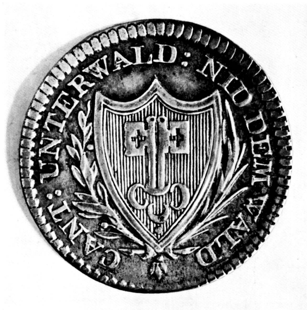
Die Nidwaldner Münzen von 1811