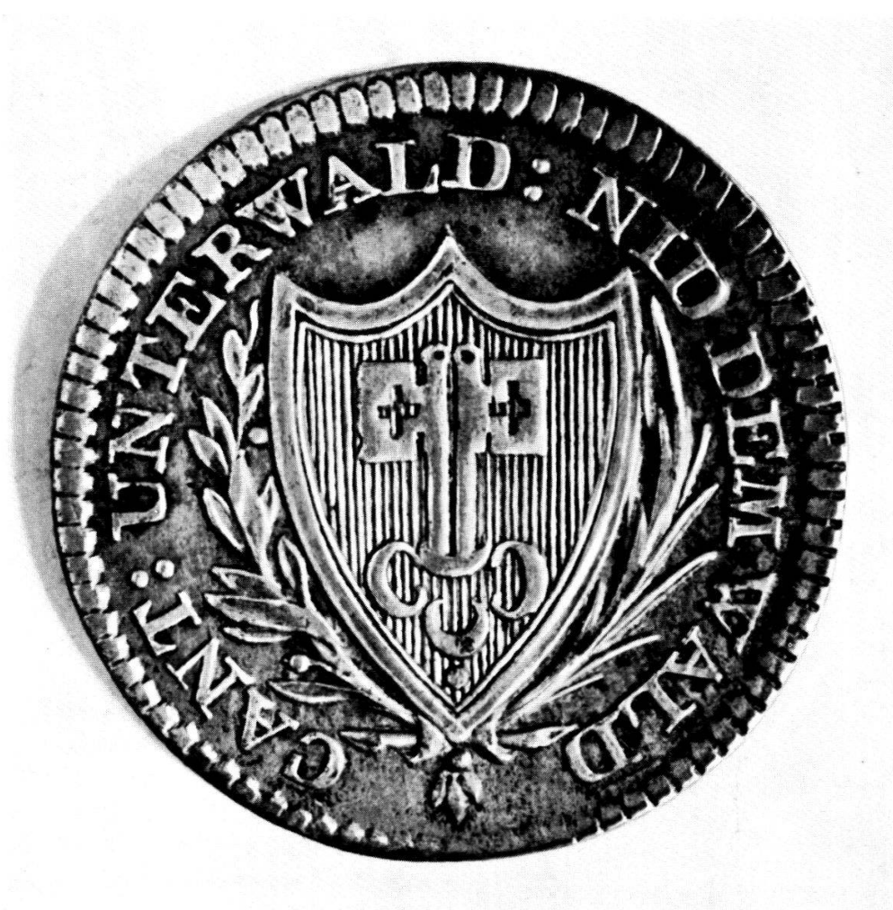
Die Nidwaldner Münzen von 1811