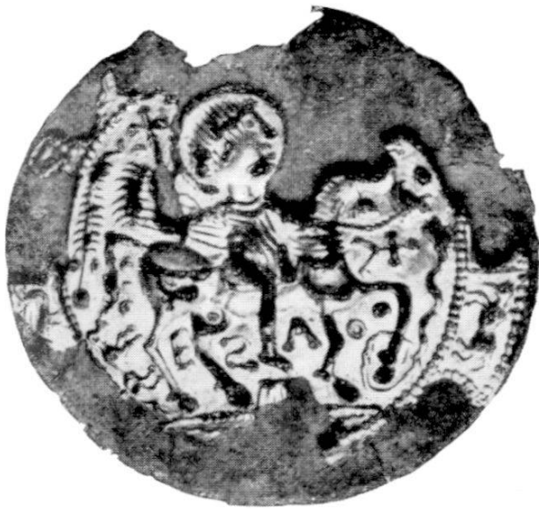
Abb. 1. Aus La Copelenaz. Zürich, Schweizerisches Landesmuseum.