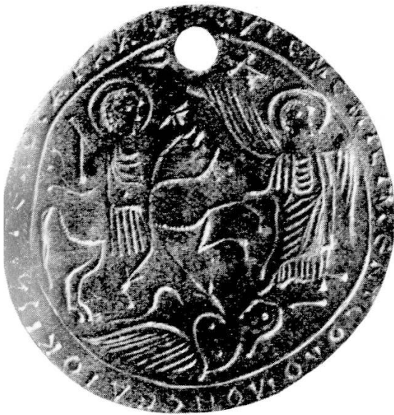
Abb. 3. Aus Kyzikos. Paris, Louvre.