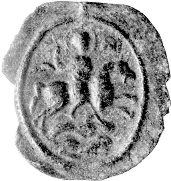
Abb. 5. Berlin, Kaiser Friedrich-Museum.