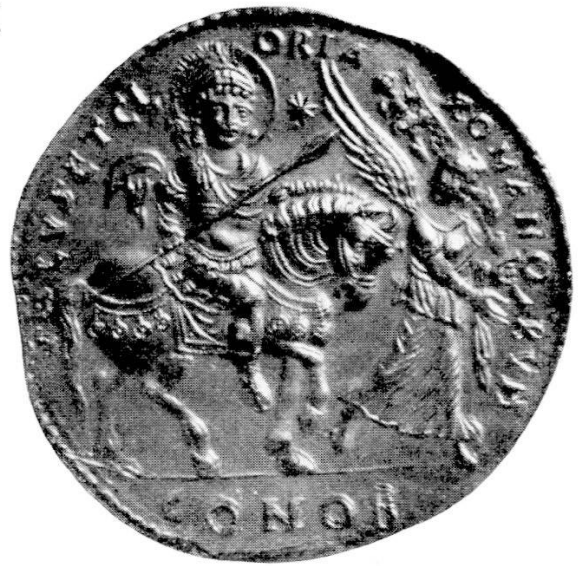
Abb. 4. Justinian. Aus Caesarea. Bis 1831 Paris, Cabinet des Medailles.