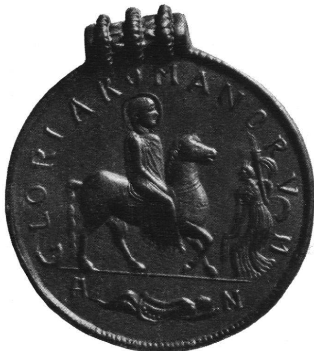
Abb. 2. Valens. Aus Szilágy Somlyó. Wien, Münzkabinett.