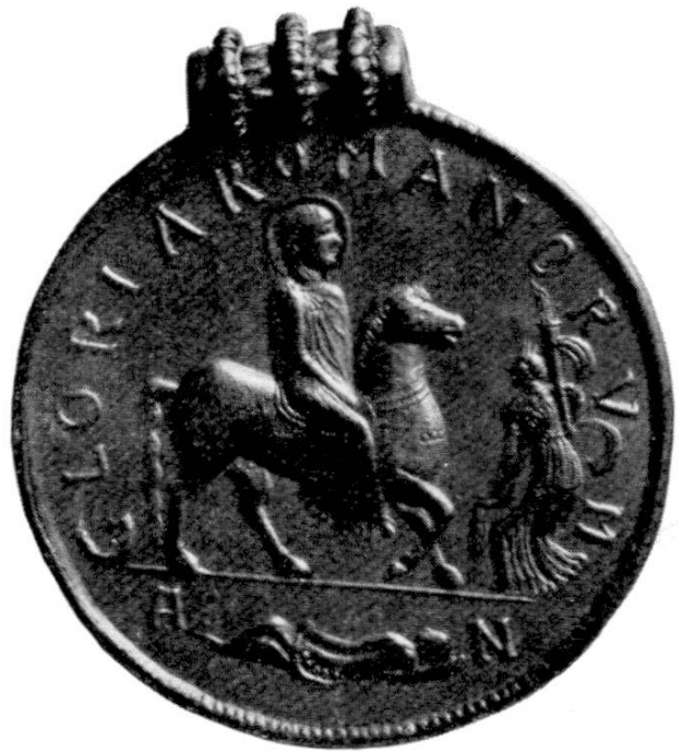
Abb. 2. Valens. Aus Szilágy Somlyó. Wien, Münzkabinett.