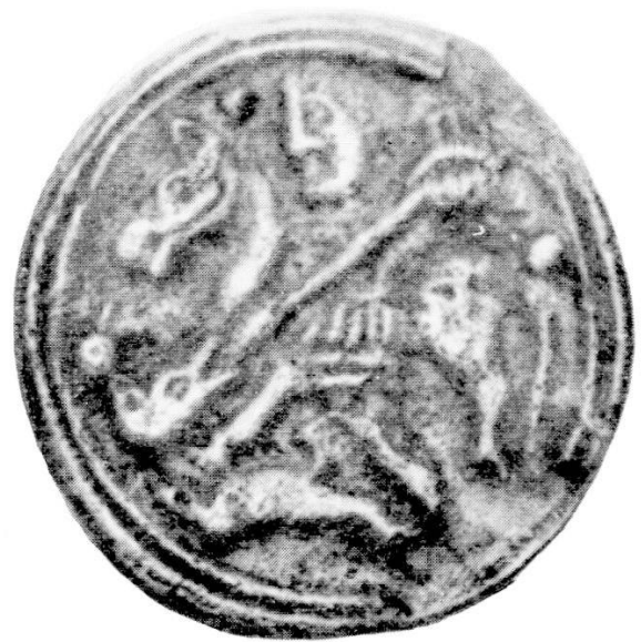
Abb. 9. Aus Rouen. Rouen, Musée archéologique.