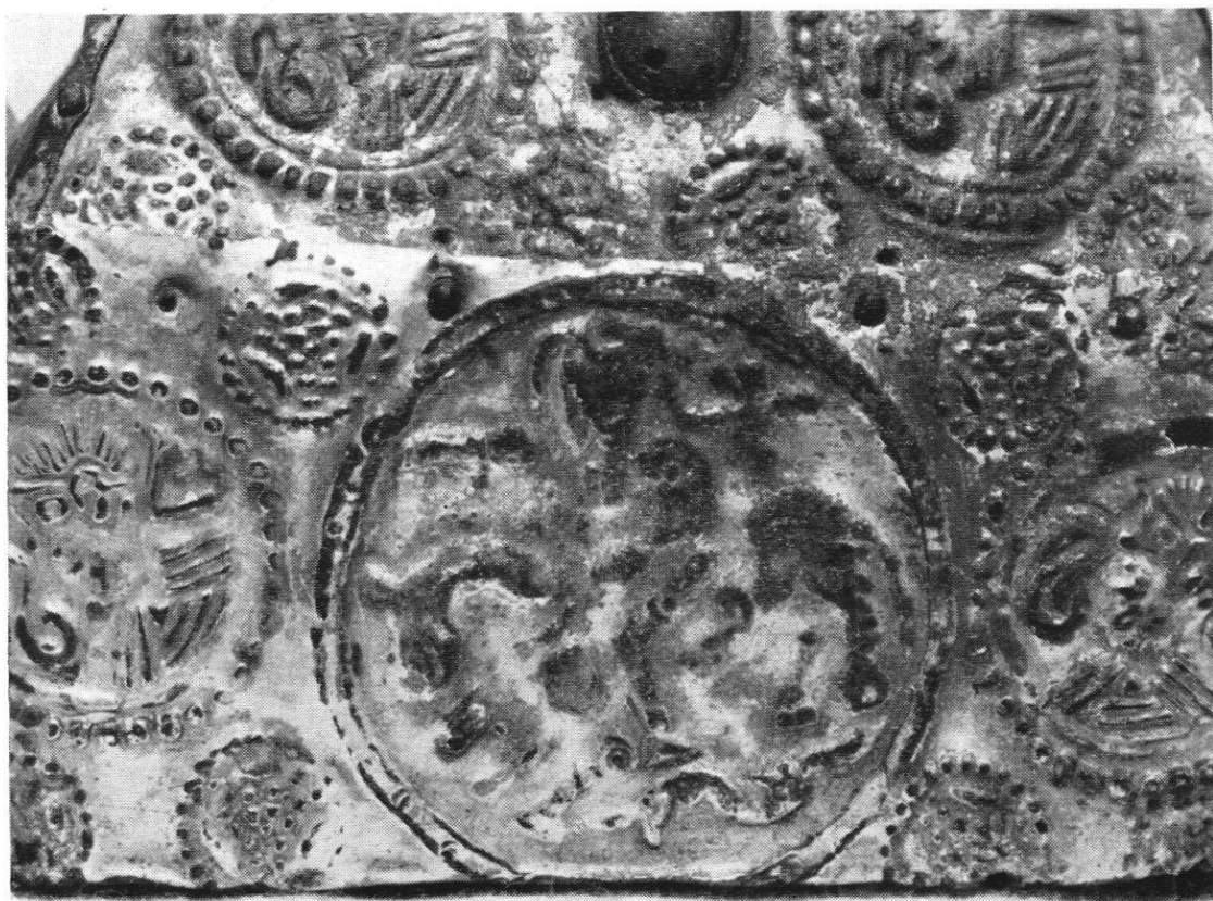
Abb. 6. Ennabeuren, Kirche.