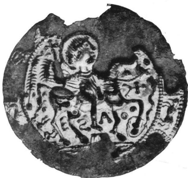
Abb. 1. Aus La Copelenaz. Zürich, Schweizerisches Landesmuseum.