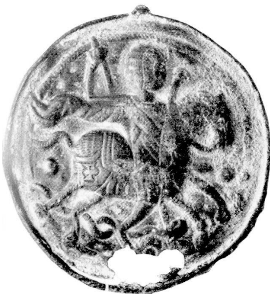
Abb. 8. Berlin, Kaiser Friedrich-Museum.