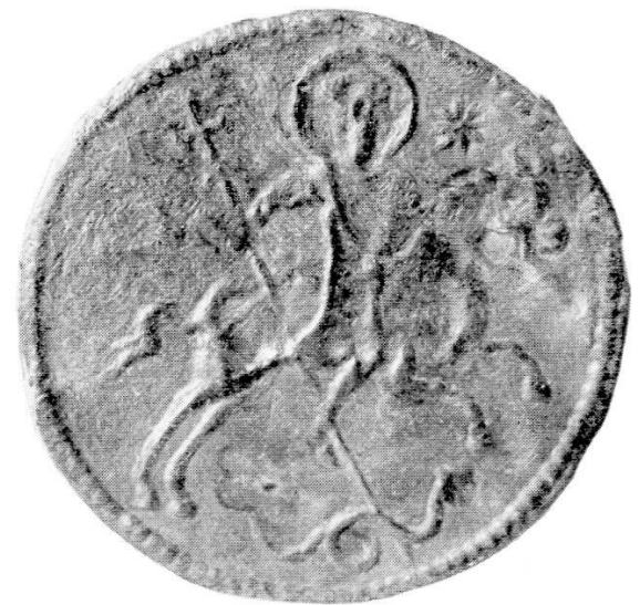
Abb. 7. Aus Strassburg. Strassburg, Museum.