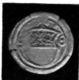
Wahlpfennig o. J. Kupfer