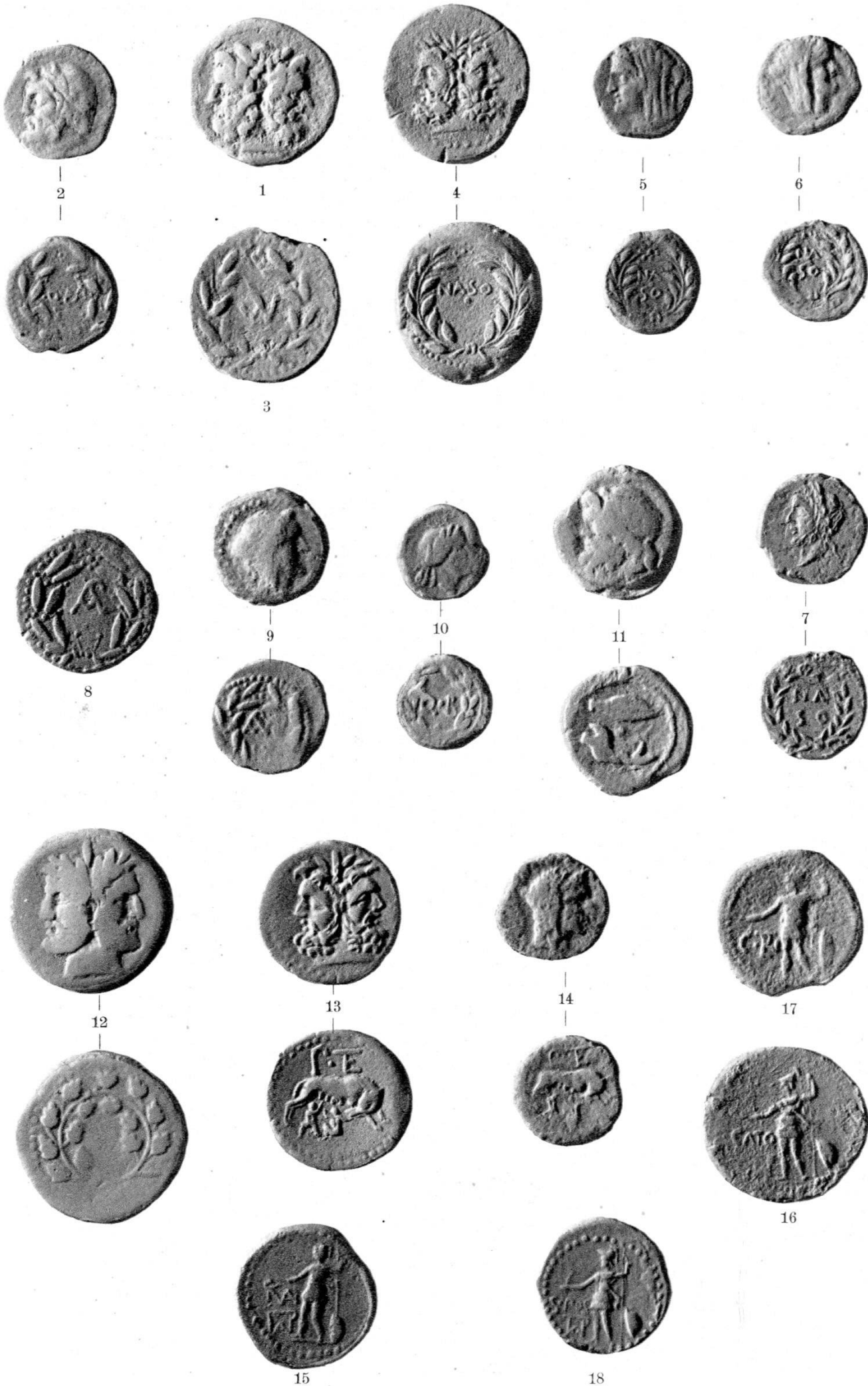
Römisch-Sizilische Münzen aus der Zeit der Republik