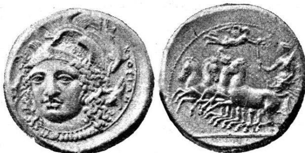
Fig. 5. — Tétradrachme gravé par Eukleidas.

Victoire, volant à droite, est sur le point de la couronner; les chevaux sont au galop; à l'exergue, un épi d'orge. Grènetis. (Fig. 5.)