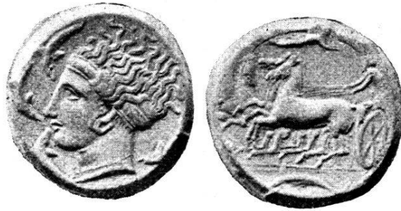
Fig. 5. — Tétradrachme gravé par Eukleidas.

( Cat. du Brit. Mus. , Sicile, n° 195. — Comte du Chastel, op. cit. , pl. VIII, n° 93.)