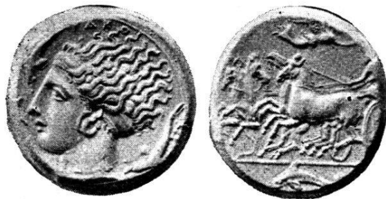
Fig. 4. — Tétradrachme gravé par Eukleidas.

Variété de la pièce précédente, de meilleur style, avec un seul bandeau derrière. (Fig. 4.)