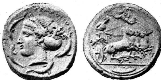
Fig. 1. — Tétradrachme gravé par les artistes Eukleidas et Evænetos.

( Catalogue du British Museum , Sicile, n° 190. — Comte du Chastel, Syracuse , pl. VII, n° 75.)