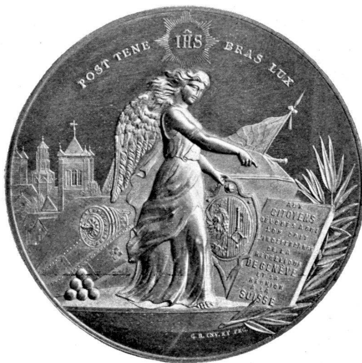
MÉDAILLE DE CH. PICTET DE ROCHEMONT, DE GENÈVE