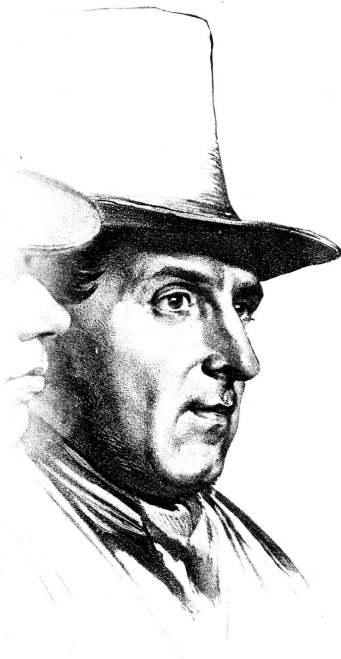
AUGUSTE BOVET, GRAVEUR GENEVOIS