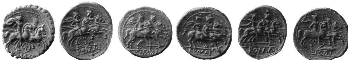
DENARI CON SIMBOLI